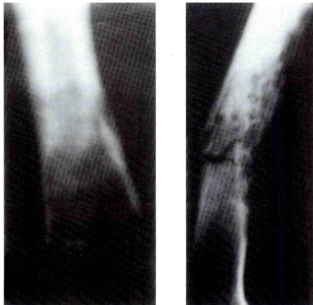
Foto 2: La imagen corresponde a Osteomiotitis crónica inespecífica de Fémur, el cual se presumía, un diagnóstico de osteosarcoma.

La radiología simple de tórax fue normal; y la del muslo izquierdo reportó imagen de osteolisis discreta con reacción y levantamiento perióstico, borramiento de los contornos del canal medular a nivel del 1/3 medio del fémur (Figura 2). El Gammagrama óseo reportó concentración anormal del radiotrasador a nivel del 1/3 medio del fémur izquierdo, que se extiende a epífisis distal. La RMN del muslo izquierdo indica lesión a nivel del muslo ubicada en la porción anteroexterna en 1/3