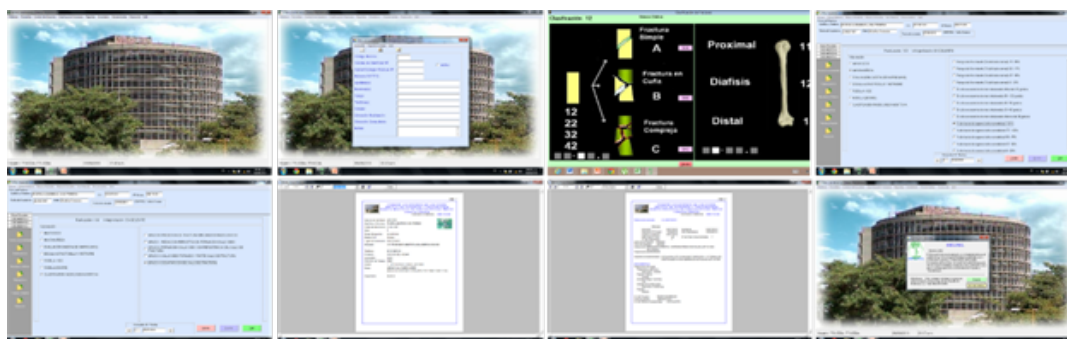
Figura 1. Base de Datos Sistematizada Traumatológica HICLINEL® versión 2.0.92

Se cumplieron los requisitos éticos de acuerdo a la Ley de Ejercicio de la Medicina, Código